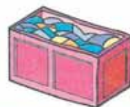
CONTAINER PER LA PLASTICA