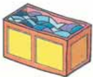
CONTAINER PER LA CARTA