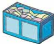
CONTAINER PER IL VETRO